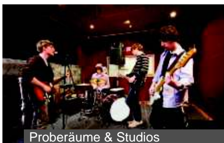
Proberäume & Studios

Die Audio-Qualität und die einfache, intuitive Bedienung von myMix hat weltweit schon tausende Musiker und Techniker überzeugt: kompromissloser Sound, Zeitersparnis beim Soundcheck und individuelles Proben „mit Band“. Von kleinen und großen Bühnen in Clubs, Konzerthallen, Theatern und Stadien, in Kirchen, Tonstudios, Übungsräumen und Musikschulen - myMix hilft überall wo Musik gemacht wird.