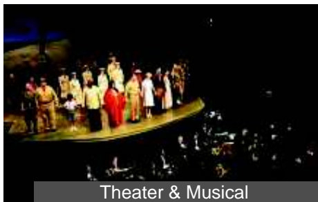
Theater & Musical

myMix CONTROL, die Web-Browser gestützte Software vervollständigt das System. Sie erlaubt sämtliche Daten schnell und bequem zu speichern und wieder zu laden, sowie IEX16 und myMix zu konfigurieren und zu editieren. myMix CONTROL ist unabhängig vom Betriebssystem des Computers, und kann sowohl kabelgebunden als auch drahtlos verwendet werden. Das Netzwerkinterface myMix PLUG verfügt über internen Speicher, so sind alle Informationen immer im System verfügbar.